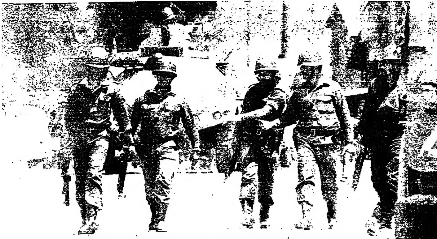
رجال « الفرقة ١٦ » أثناء عملية الانتماء امس .

يقبل التحول لهذه الدورة لغاية ١٢ ايار ١٩٧٥